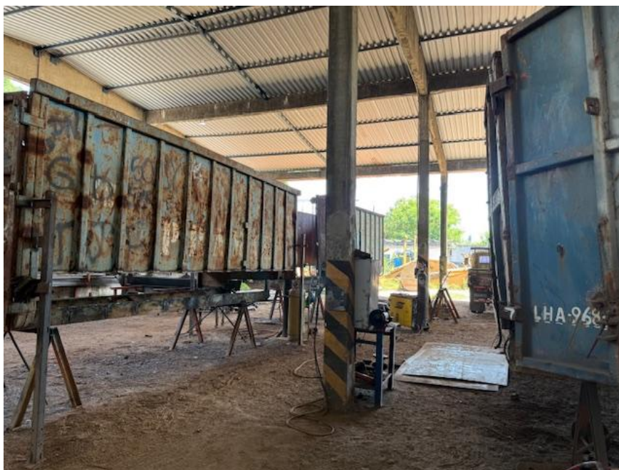
Figura 8 - Oficina de chapa

O Administrador Judicial diligenciou no dia 07/06/2024 às 10:30 na Estrada do Pedregoso, 3785, Campo Grande – Rio de Janeiro e visitou o bem “Shredder” dado em garantia para pagamento da Classe I, conforme o Plano de Recuperação Judicial de id. 95507994.