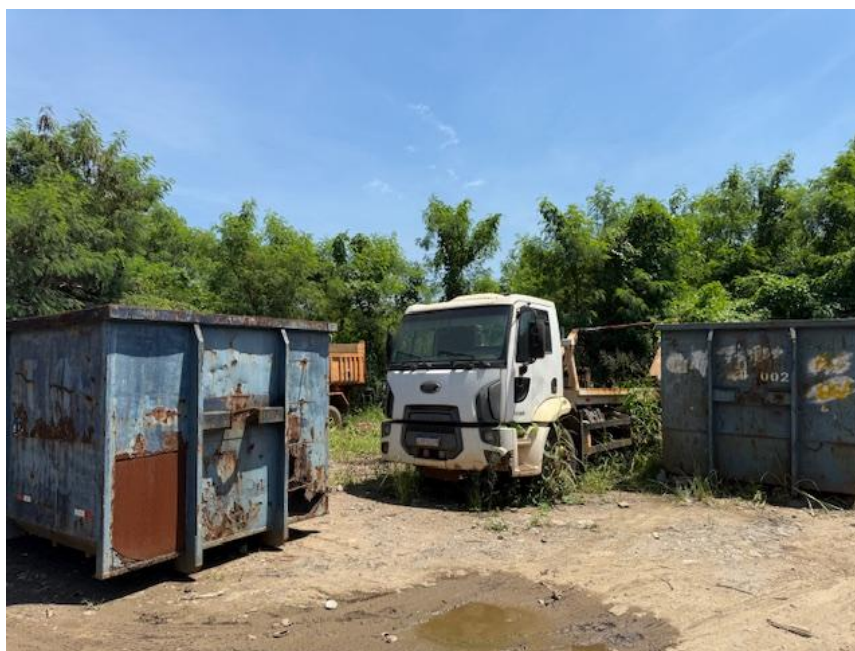
Figura 4 - Operação e estoque de sucata