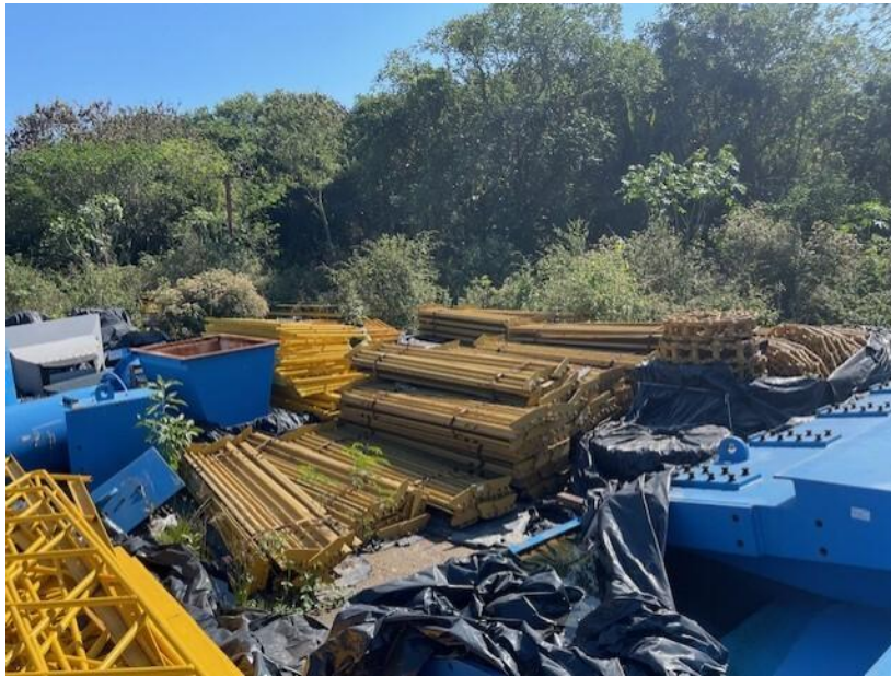
Figura 9 - Esteira transportadora

avaliação do bem em comento, sendo necessária a contratação de profissional para tanto.