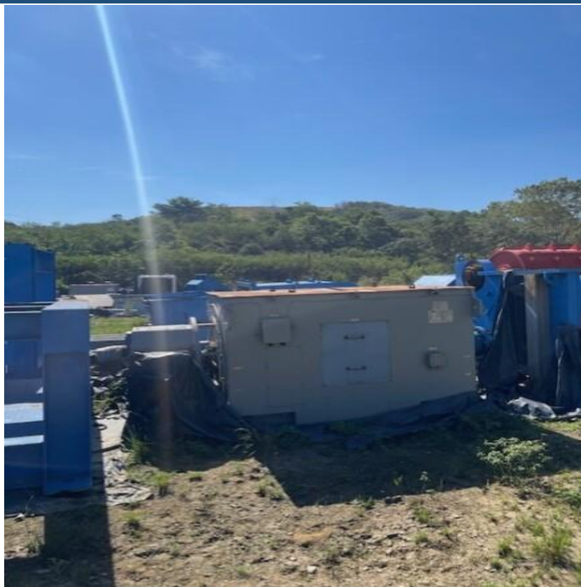
Figura 13 - Motor elétrico do moinho