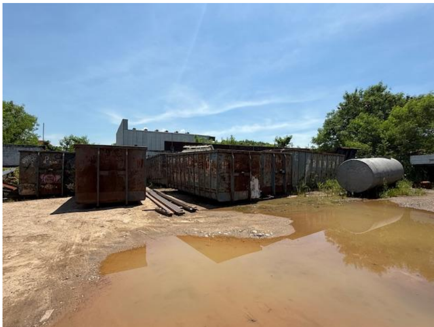
Figura 2 - Operação e estoque de sucata