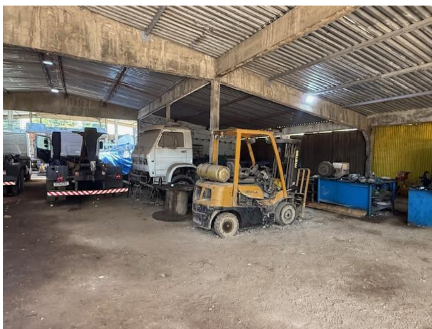
Figura 6 - Oficina de caminhão