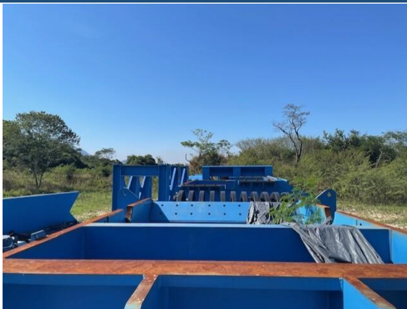
Figura 11 - Moinho