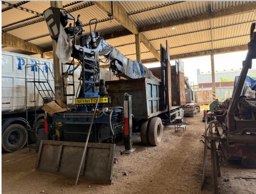
Figura 7 - Oficina de chapa