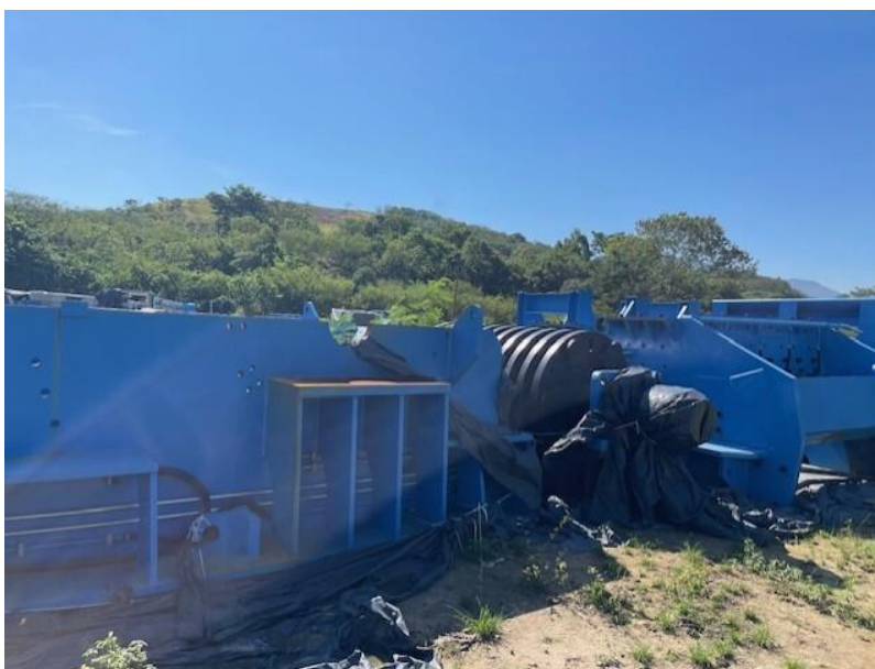
Figura 12 - Moinho