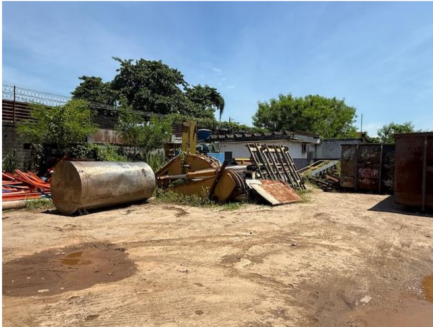
Figura 1 - Operação e estoque de sucata

O Administrador Judicial, na diligência mais recente à sede das recuperandas - situada na Avenida Demétrio Ribeiro, 717 – Duque de Caxias, Rio de Janeiro, ocorrida em 03/02/2025, visitou as seguintes áreas de operação da empresa: