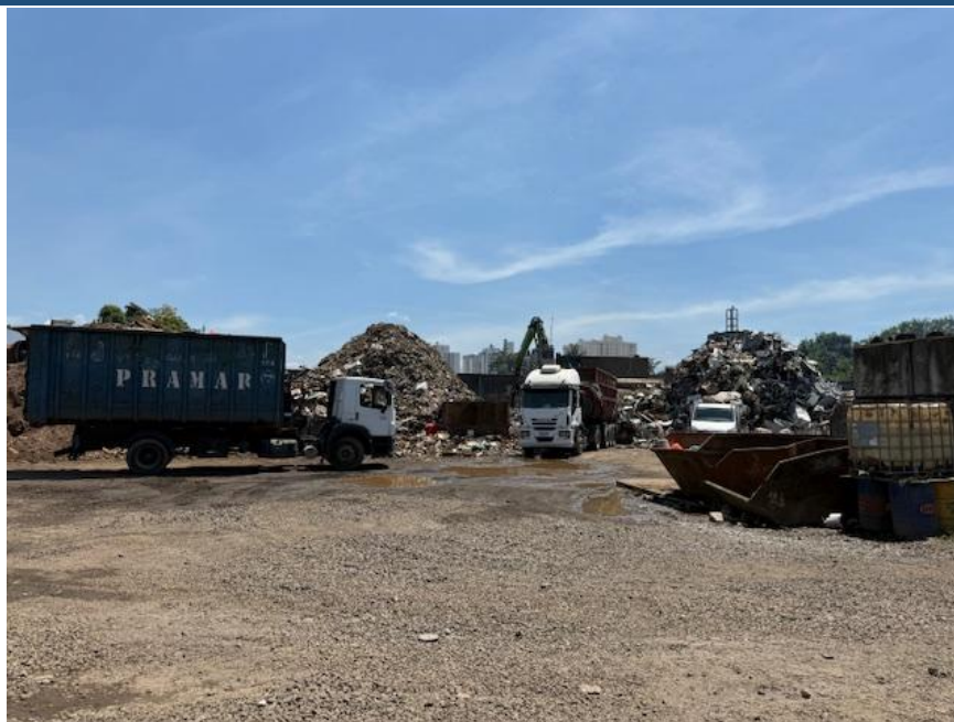
Figura 3 - Operação e estoque de sucata