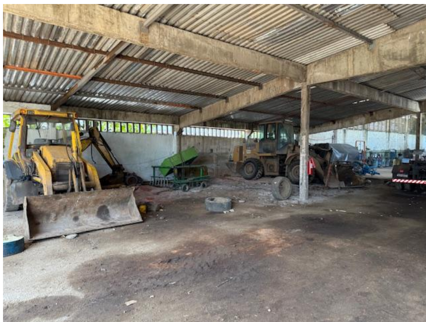
Figura 5 - Oficina de caminhão