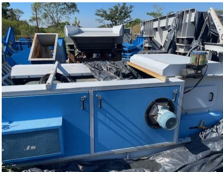
Figura 11 - Eddy Current