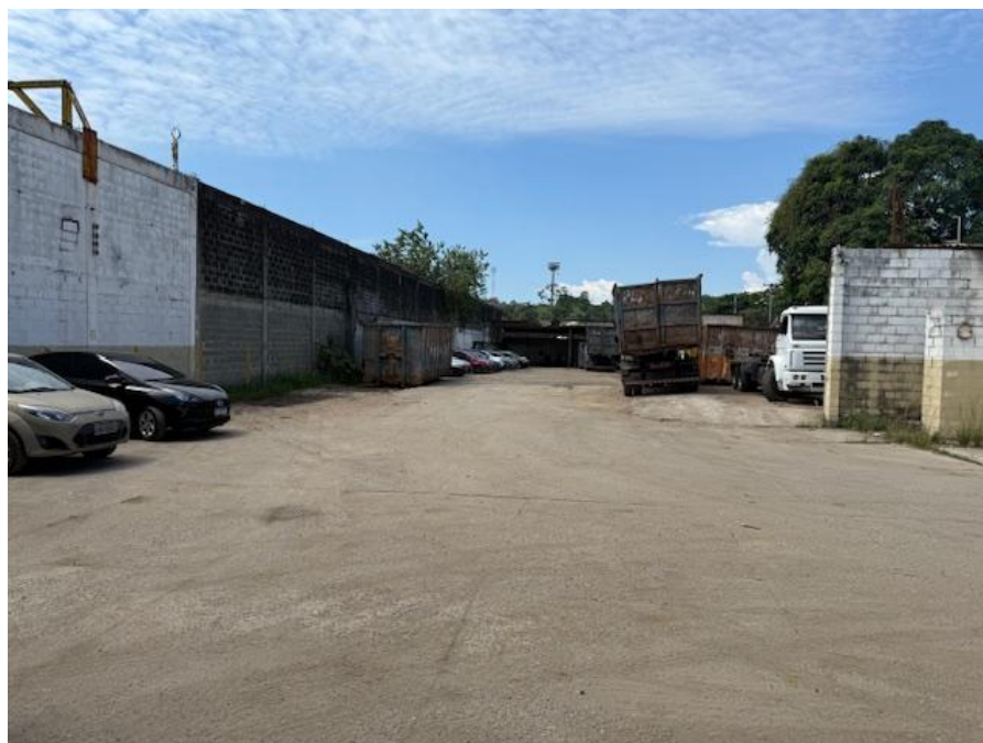
Figura 2 - Operação e estoque de sucata