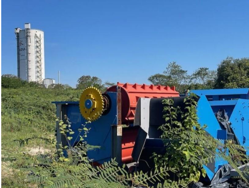
Figura 4 - Alimentador do moinho