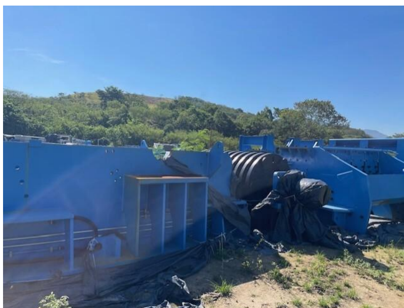
Figura 6 - Moinho