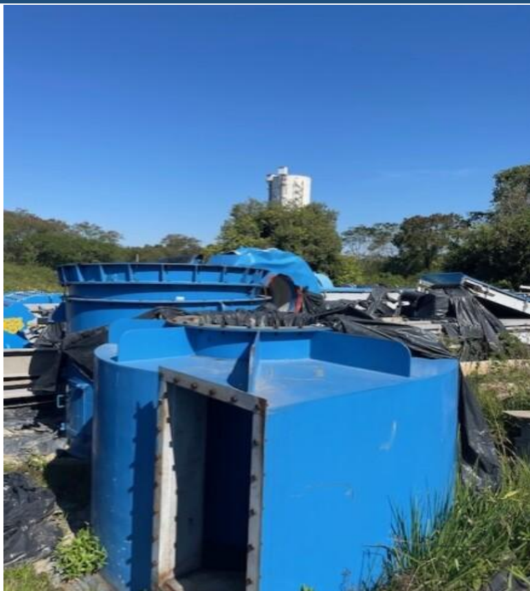
Figura 9 - Peças do ciclone