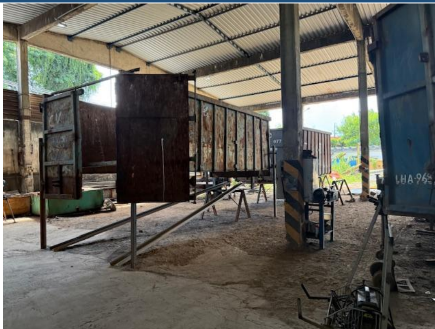
Figura 1 - Oficina de chapa