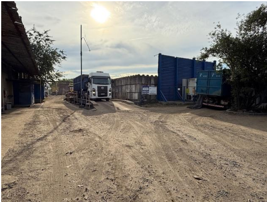
Figura 1 - Balança

O Administrador Judicial realizou diligência, no mês de novembro de 2025, à sede das Recuperandas - situada na Avenida Demétrio Ribeiro, 717 – Duque de Caxias, Rio de Janeiro.