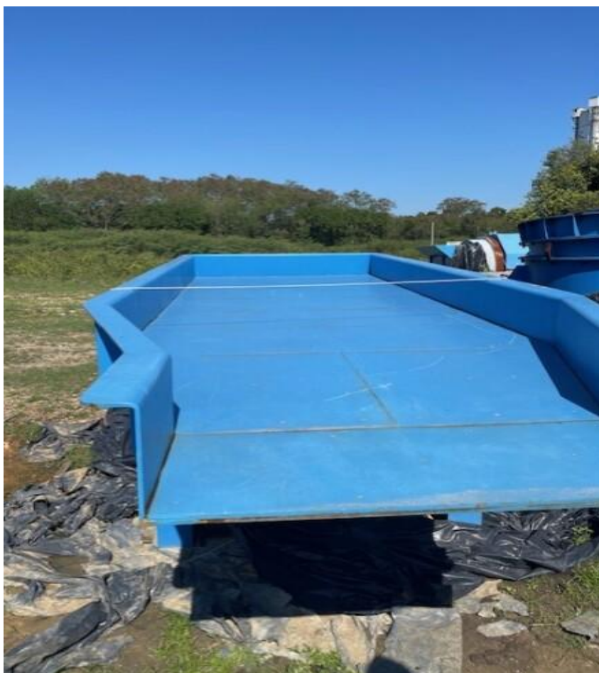
Figura 17 - Mesa vibratória