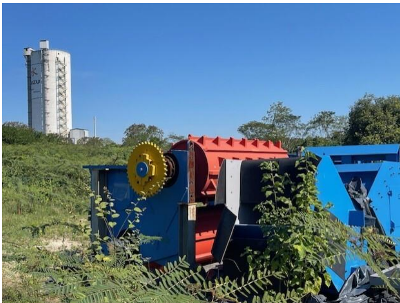
Figura 13 - Alimentador do moinho