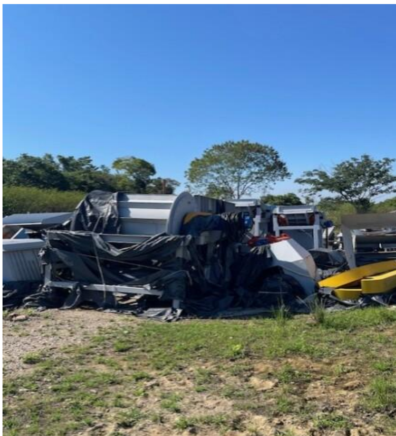
Figura 19 - Tambor duplo magnético